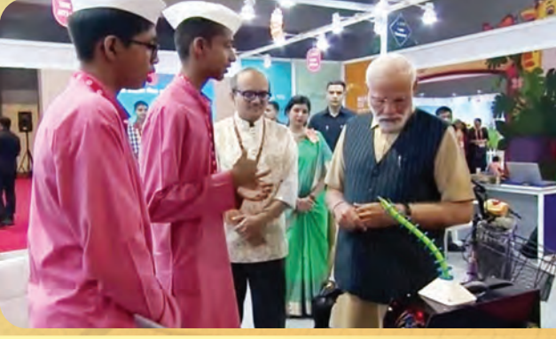
दिल्ली येथील प्रदर्शनात प्रशालेच्या एलिफायर प्रकल्पाच्या स्टॉलला मा.पंतप्रधानांची भेट