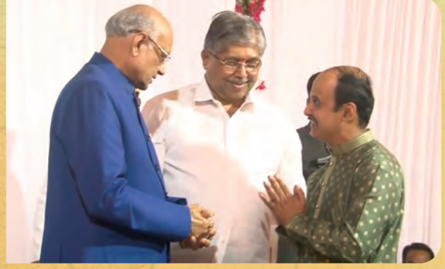
मुंबई येथील स्नेहमेळाव्यात मा. राज्यपाल रमेशजी बैस व चंद्रकांतदादा पाटील यांची भेट