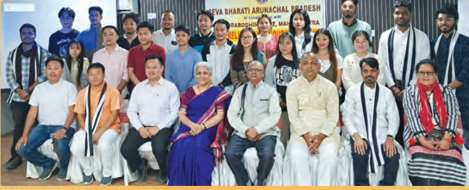
अरुणाचल प्रदेश – केंद्रीय लोकसेवा आयोग प्रशिक्षण वर्ग २०२३-२४ समारोप प्रसंगी उपस्थित मान्यवर व विद्यार्थी